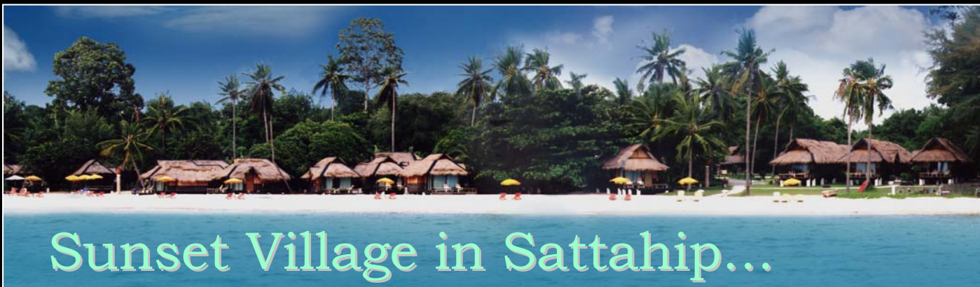
Sunset Village in Sattahip...